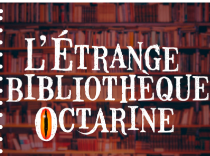
LA BIBLIOTHÈQUE OCTARINÉ La cie Du Fil à Retordre - dès 10 ans