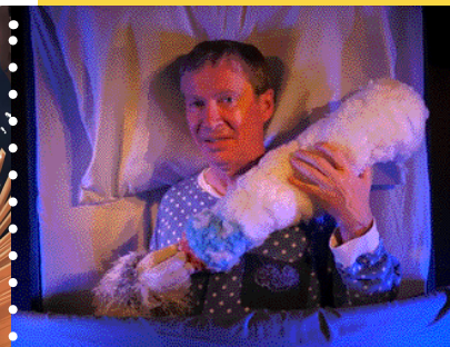
DUCHESSE La Toute Petite Compagnie - dès 3 ans