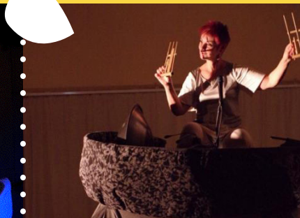
SOI Compagnie Rêves d'Elles - dès 18 mois